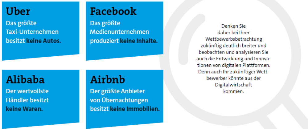
Abbildung 2 Quelle Bitkom In 10 Schritten digital. Praxisleitfaden für den Mittelstand